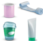
Pots et tubes