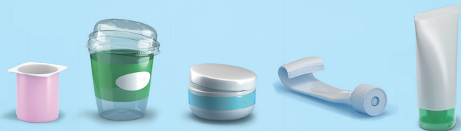
Pots et tubes