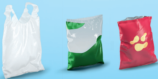
Sacs et sachets