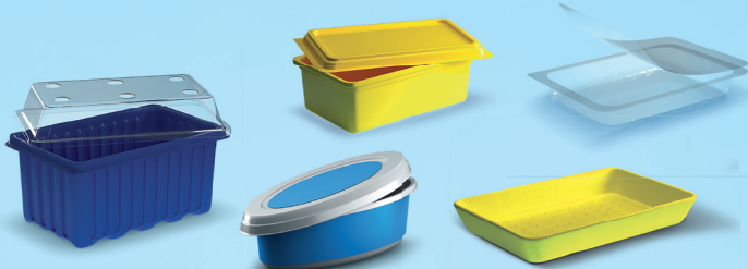
Barquettes et ravers