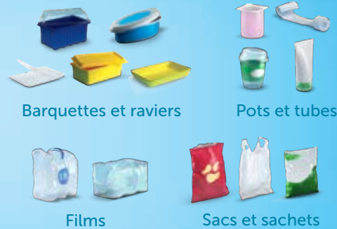
Barquettes et rapiers