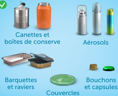
Canettes et boîtes de conserve