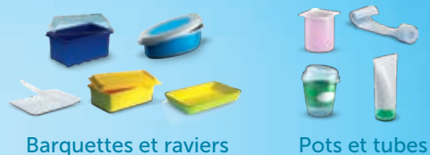
Barquettes et ravier