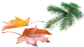
Déchets végétaux de jardin