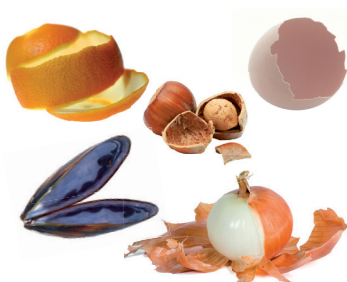
Épluchures, coquilles et os