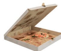
Cartons alimentaires souillés