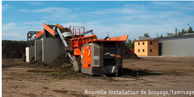
Nouvelle installation de broyage/tamissage

Opérationnel depuis mars 1996, le centre de compostage de BEP Environnement à Naninne traite les déchets verts collectés dans les parcs à conteneurs et par les services communaux. Sa capacité de traitement est de 30.000 tonnes par an.